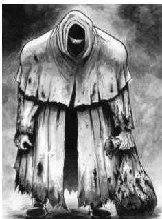
O home do saco

O conxunto de obras que conservamos podemos agrupalas atendendo aos xéneros aos que pertencen. Aínda que temos representacións dos tres xéneros é moitísimo maior o número de textos pertencentes á lírica e á narrativa, pois do xénero dramático apenas se conservan algúns textos.